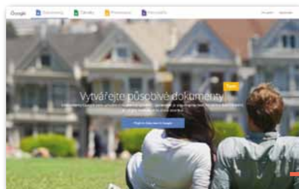
Náhled úvodní stránky Google dokumenty:

Seznamte žáky nejprve s principem fungování vzdálených datových úložišť. Při nasdílení společného dokumentu v Google dokumenty budou žáci pozváni k prohlížení dokumentu prostřednictvím e-mailu. Po kliknutí na příslušný odkaz se budou muset pomocí své e-mailové adresy též zaregistrovat na portálu Google dokumenty. U portálu Capsa.cz po zaregistrování projektu sdělíte žákům adresu založeného projektu a přístupové heslo. Společně si projděte strukturu nebo základní funkce daného portálu. Samotné používání textového nebo tabulkového editoru již funguje prakticky stejně jako v programu Word či Excel, stejně jako vytváření a správa souborů.